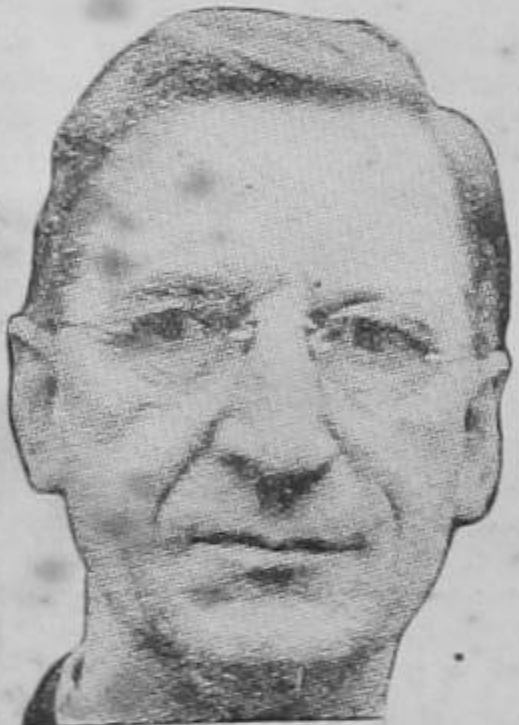
EAMON DE VALERA